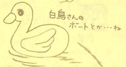
白鳥さんの ボートとか...ね

お米をつぶしたものを杉の木の串につけて、甘いお味噌を ぬって炭火であぶったもので、まあ田舎流ファーストフードと いったところでしょうか? 香ばしくてオイシイよ♡