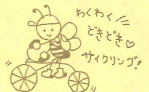
わくわく♡ ときどき♡ サイクリング!